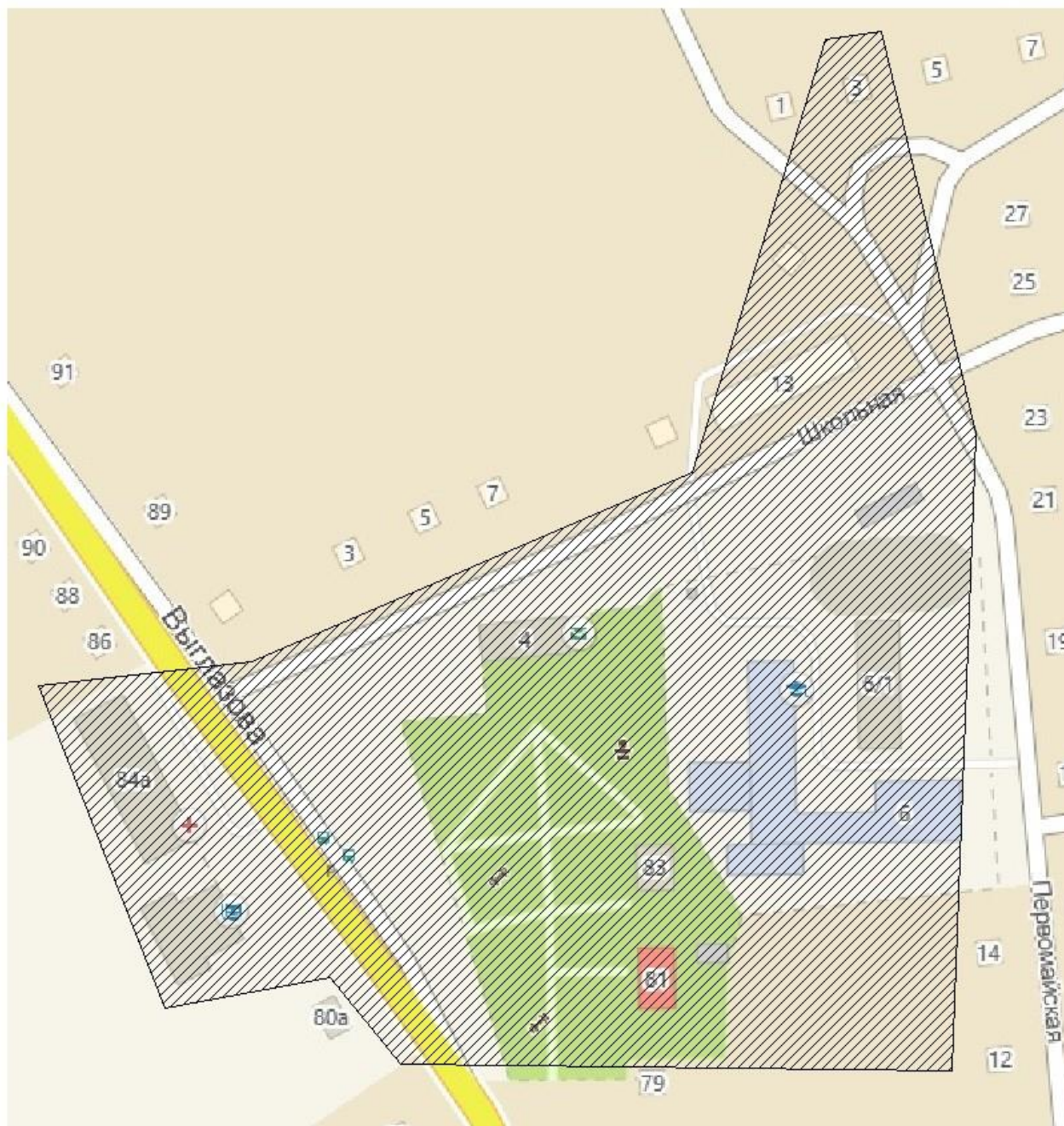
Рисунок 1. Зона деятельности МУП «Бобровское ЖКХ» Сузунского района в селе Шайдурово.

Теплоснабжение в селе централизованное и охватывает центральную часть села. Источник теплоснабжения один – котельная МУП «Бобровское ЖКХ». В качестве индивидуального теплоснабжения используется печное отопление.