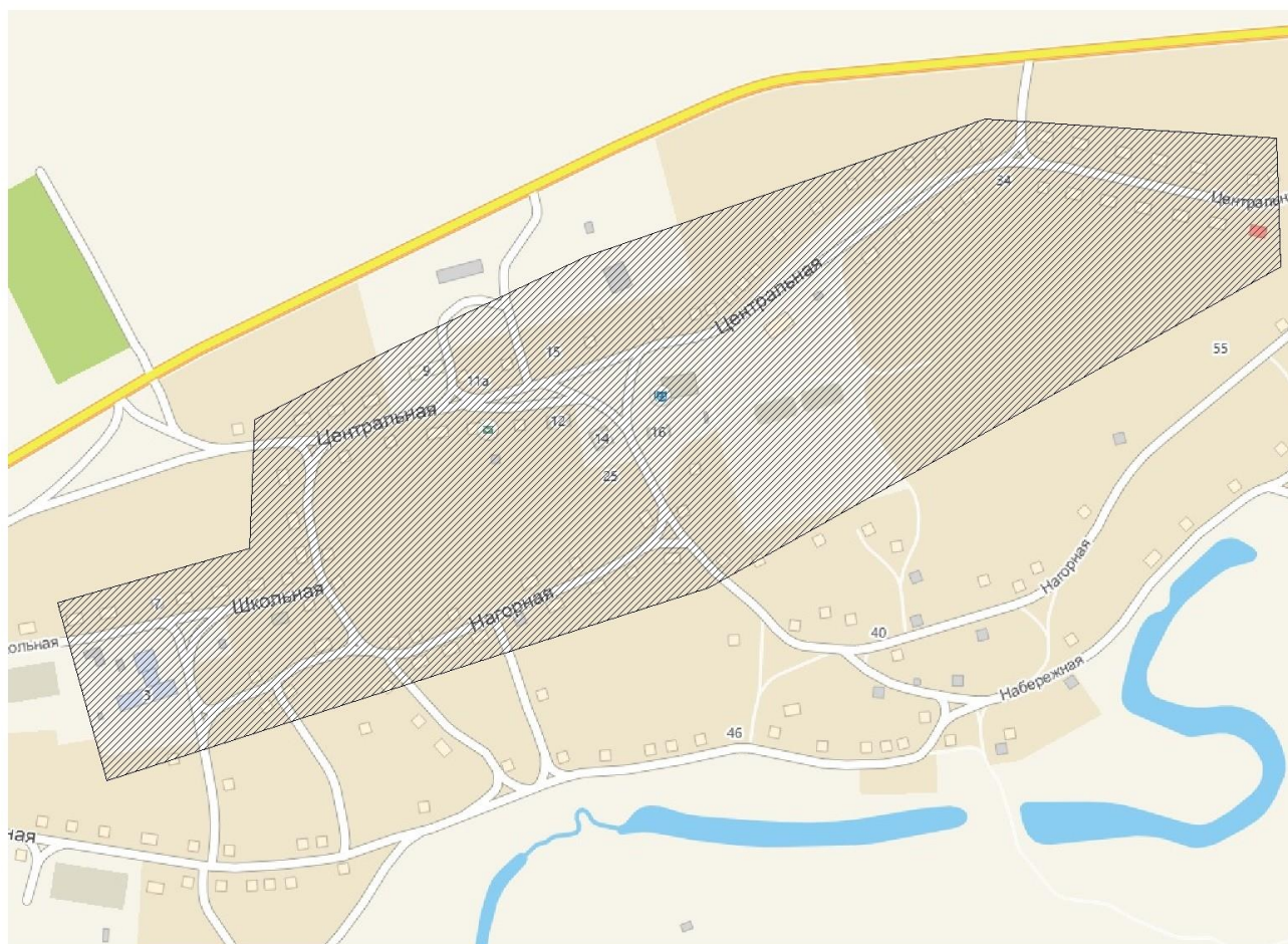
Рисунок 1. Зона деятельности ОАО «Сузунское ЖКХ» Сузунского района в селе Малышево.

Теплоснабжение в селе централизованное и охватывает центральную часть села. Источник теплоснабжения один – котельная ОАО «Сузунское ЖКХ». В качестве индивидуального теплоснабжения используется печное отопление.