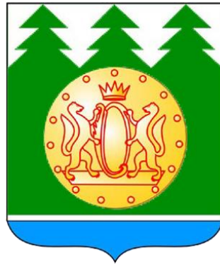
Схема теплоснабжения Малышевского сельсовета Сузунского района Новосибирской области до 2032 года (Актуализация на 2024 год)

8 (383) 351-66-00, 312-03-51 kvestservis@mail.ru