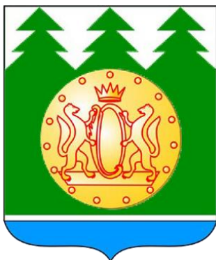
Схема теплоснабжения Болтовского сельсовета Сузунского района Новосибирской области до 2032 года (Актуализация на 2024 год)

8 (383) 351-66-00, 312-03-51 kvestservis@mail.ru