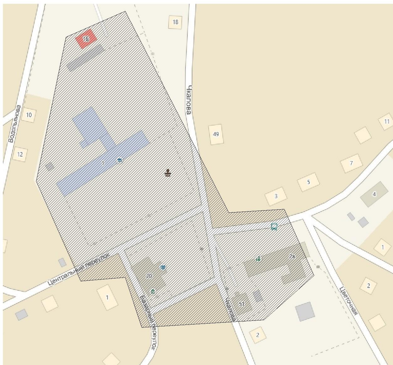
Рисунок 1. Зона деятельности ИП Федоров О.Ю. Сузунского района в селе Мереть.

Теплоснабжение в селе централизованное и охватывает центральную часть села. Источник теплоснабжения один – котельная ИП Федоров О.Ю. В качестве индивидуального теплоснабжения используется печное отопление.