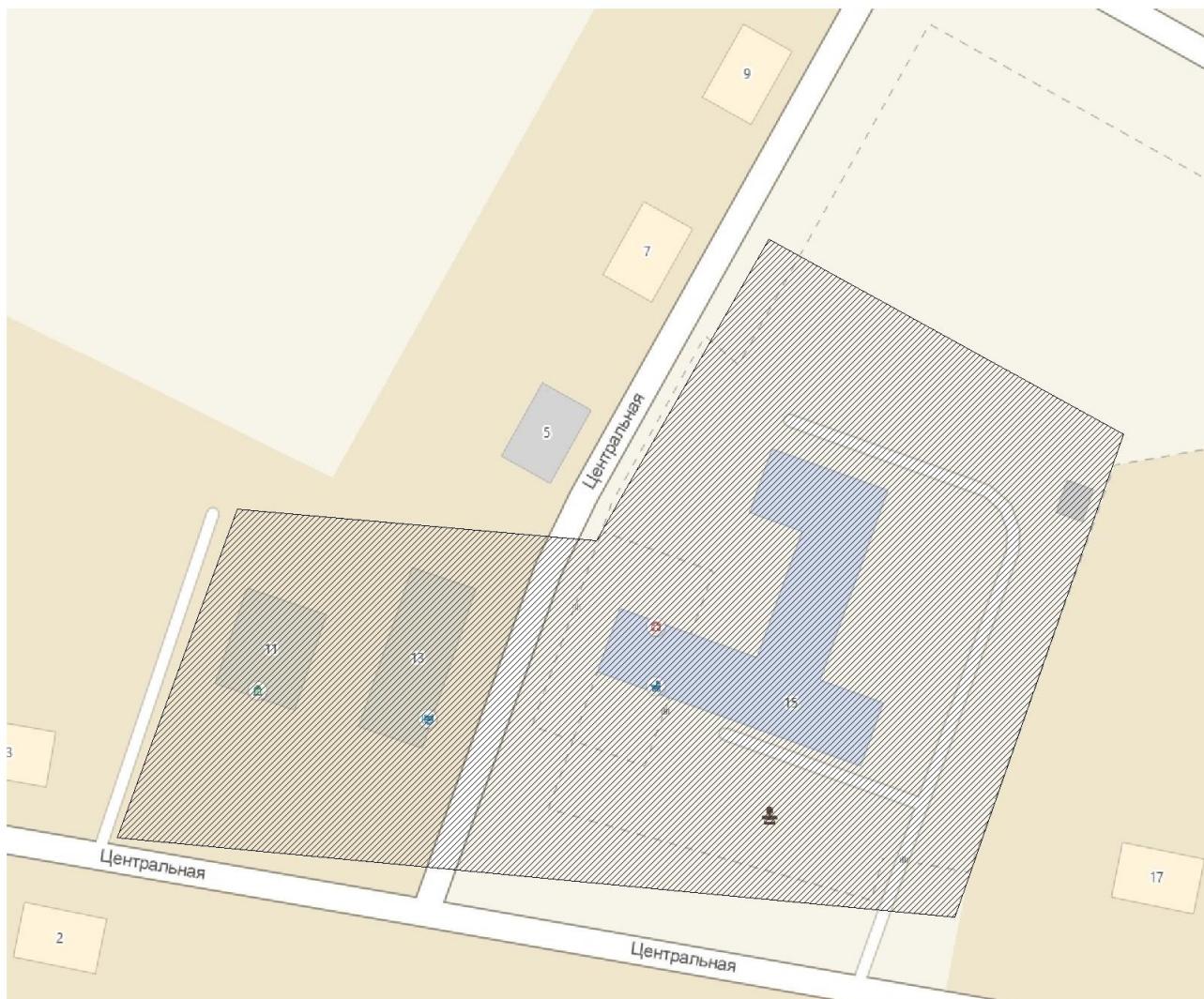
Рисунок 1. Зона деятельности МУП «Шарчинское ЖКХ» в с. Маюрово.