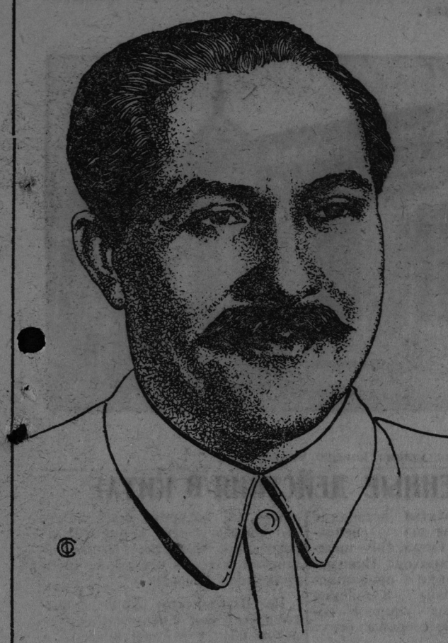
Л. М. Каганович.