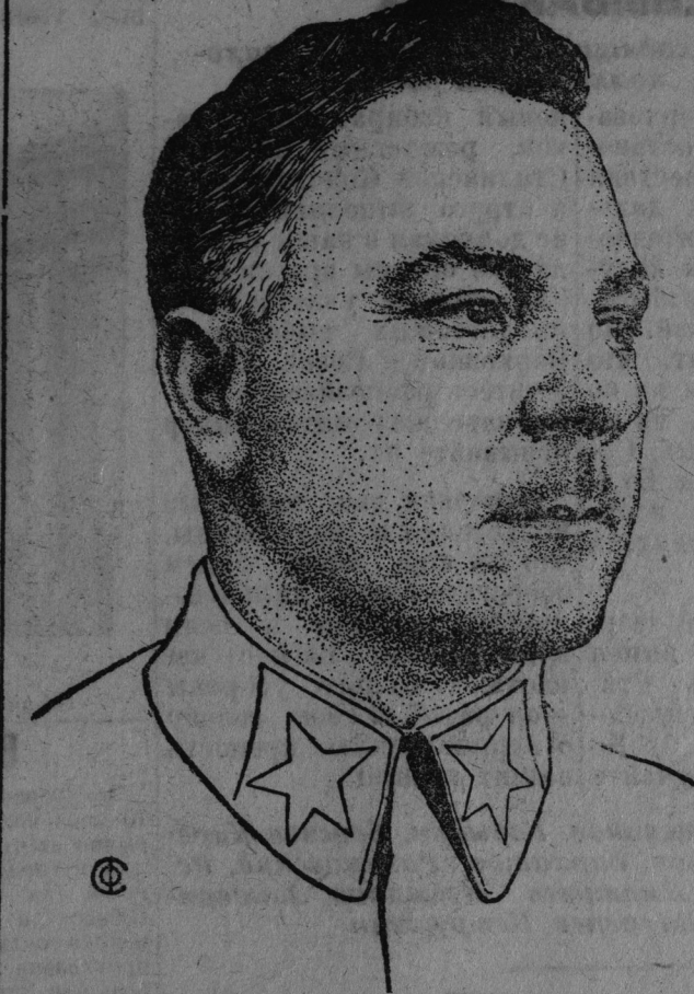
К. Е. Ворошилов.