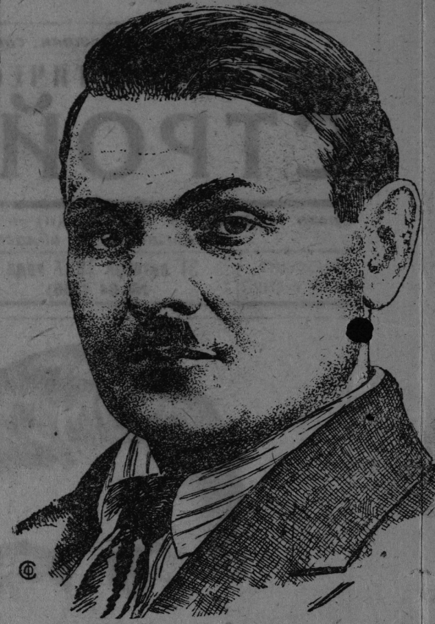
А. А. Жданов.