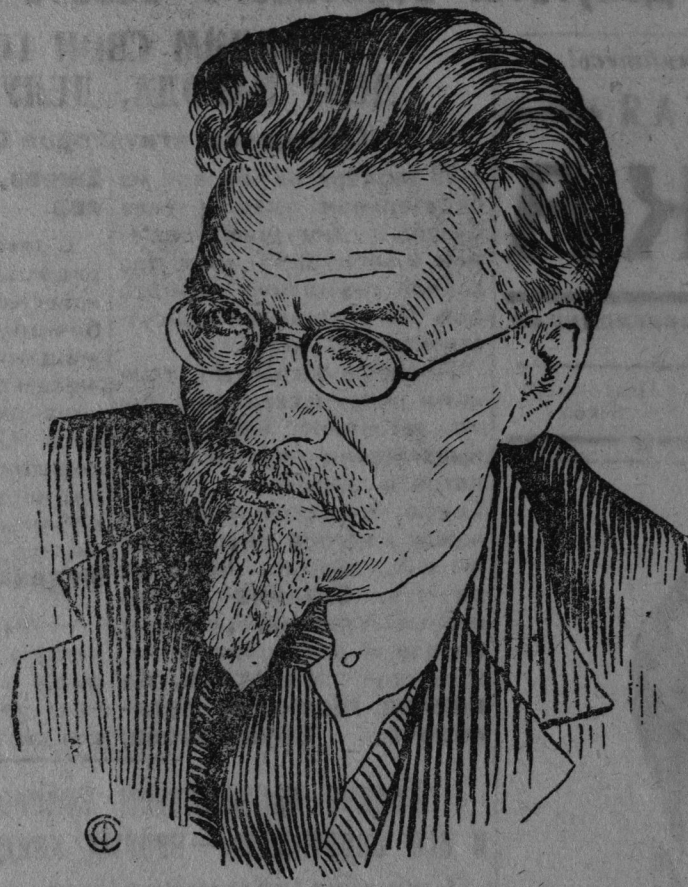
М. И. Калинин.