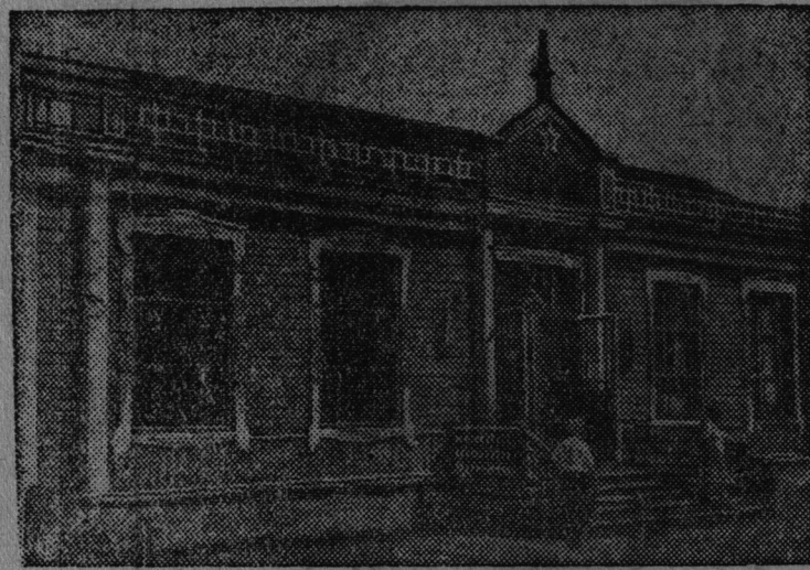
Общий вид здания нового универмага.

В нынешнем году в селе Башмаковка (Наримановского района, Сталинградской области) выстроен новый универмаг.