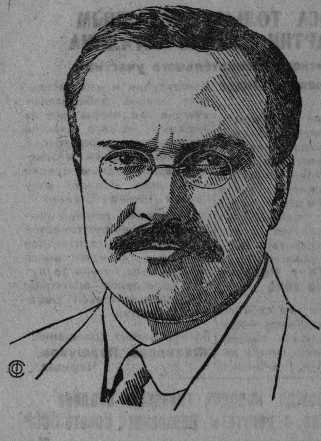
В. М. Молотов.