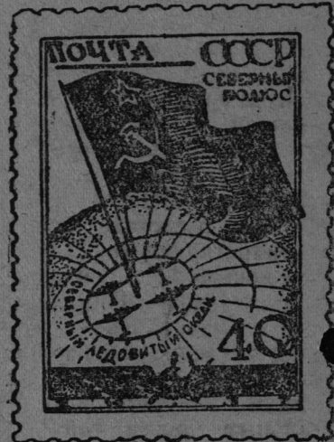
Новые марки (в увеличенном виде).