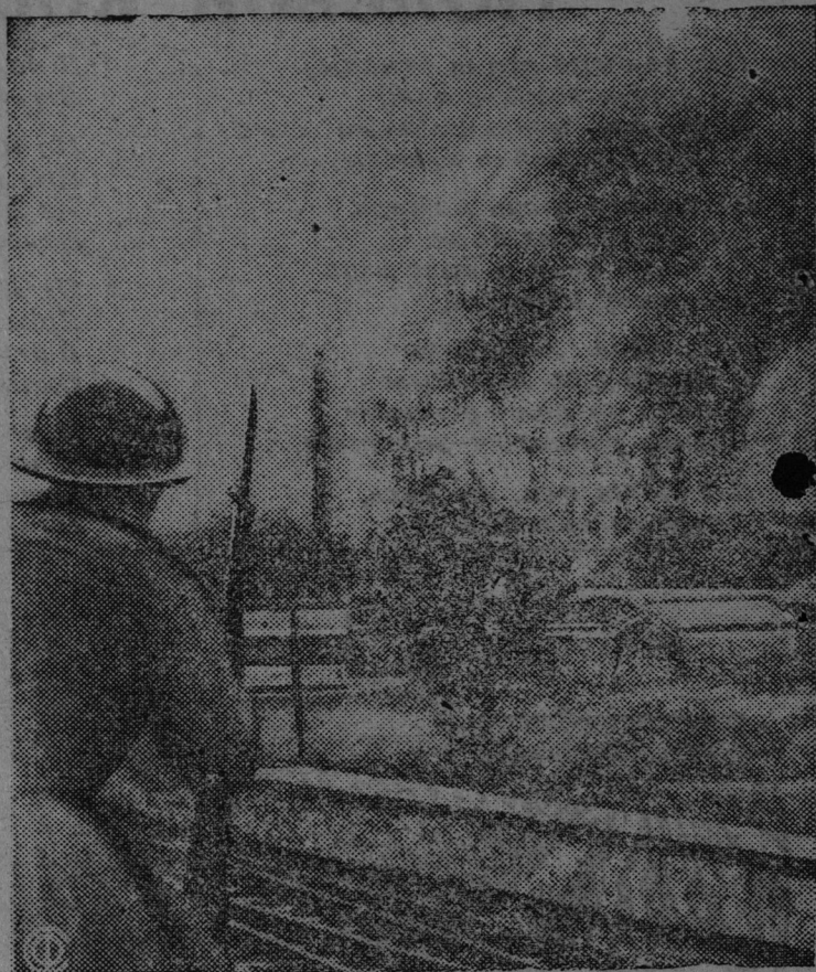
Пожар в Тяньцзине, вызванный бомбардировкой японских захватчиков.