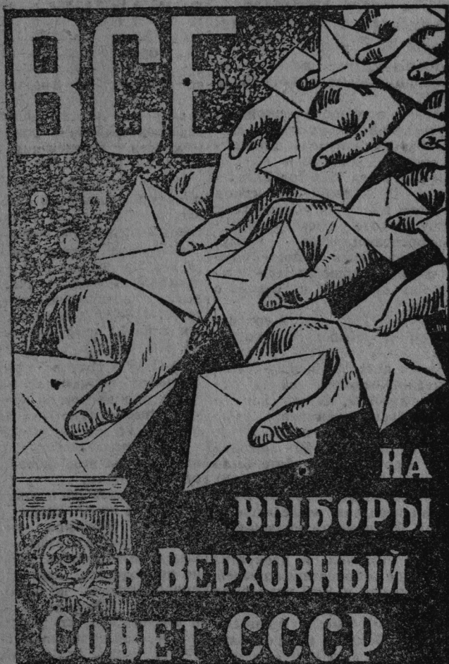
НА СНИМКЕ: „Все на выборы в Верховный Совет СССР“.—плакат работы художника Корецкого, выпускае- мый ИЗОГИЗ'ом.