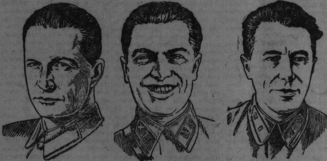
На снимке: Герой Советского Союза т. М. М. ГРОМОВ, ЮМАШЕВ, ДАНИЛИН.