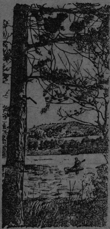
На снимке: Уголок Прокопьевского Парка культуры и отдыха имени Бубнова.