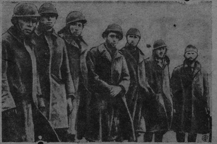
На снимке: Итальянские солдаты, взятые в плен правительственными войсками на фронте Гвадалахары.