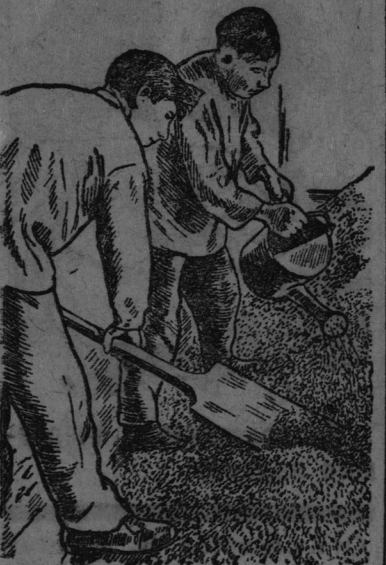
Свыше 260 центнеров семян яровизируются в колхозе „Искра“, Белоглазовского района, в этом году.

Весь посев зерновых произвести сеялками, на каждый диск конной сеялки дать не менее 11 гектаров. Весь посев яровых произвести в 10 — 11 дней. В каждом колхозном стане оборудовать столовые и красные уголки, при каждом стане иметь навесы для лошадей, к началу посевных работ всех рабочих лошадей довести, как минимум, до средней упитанности.