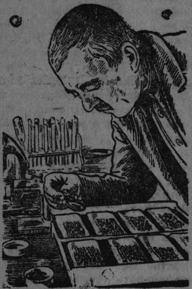
Белоглазовский район. В этом году хата-лаборатория колхоза „Искра“ пополнилась новым оборудованием на сумму 1300 рублей.

Для проверки соревнования в обоих колхозах избрана комиссия.