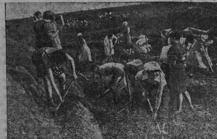
В прифронтовой полосе. Население роет противотанковые рвы.